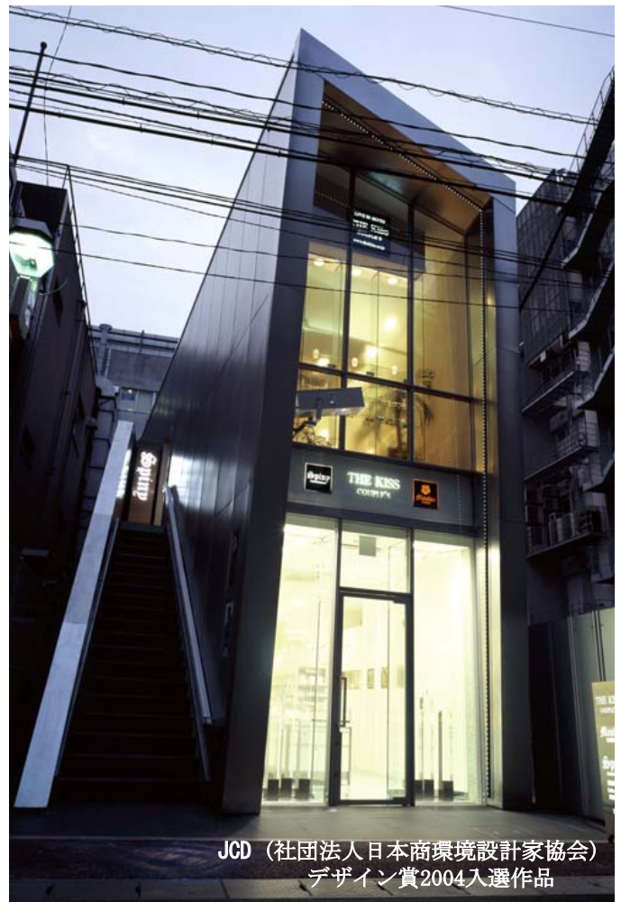
JCD（社団法人日本商環境設計家協会） デザイン賞2004入選作品

また、レンタル方式として、1・2階それぞれ個別または全棟一括、いずれの場合でも貸し出せるシステムを考案した。